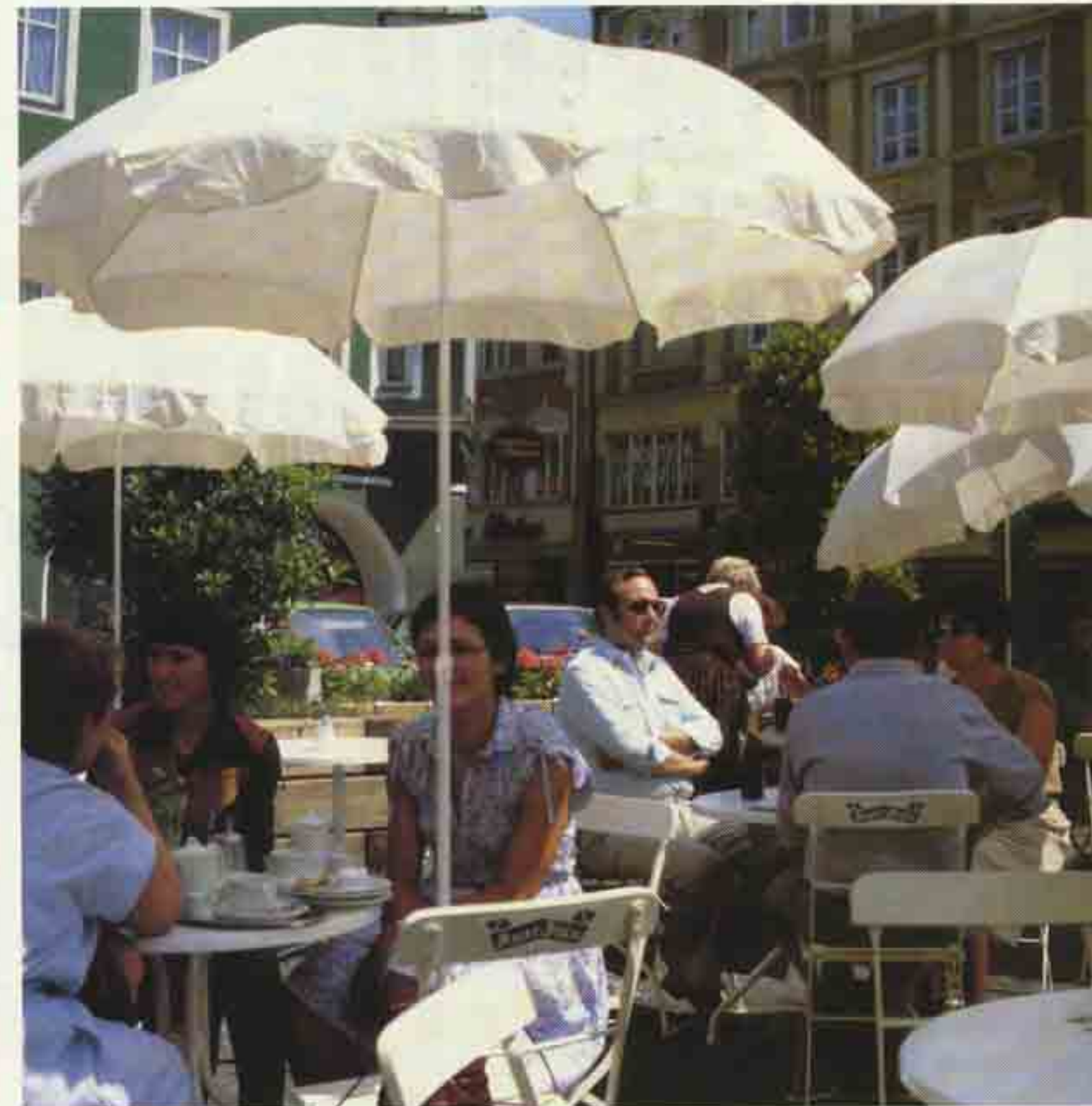
Stadt ist unser Café.