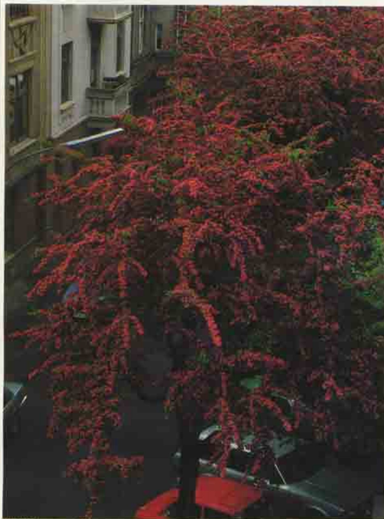
Stadt ist unsere Allee.

Die Stadt ist unsere Heimat. Für den einen eine Kleinstadt, eine Marktgemeinde. Für den anderen eine Millionenstadt. Wir sagen: unsere Wohnung, unser Betrieb, unser Sportplatz, unsere Straße, unser Kino, unser Rathaus, unsere Schule. Alles in Allem meinen wir damit unsere Stadt. Hier wächst Verantwortung für unsere Umwelt und unsere Politik, („politisch“ kommt von „polis“ – die Stadt!).