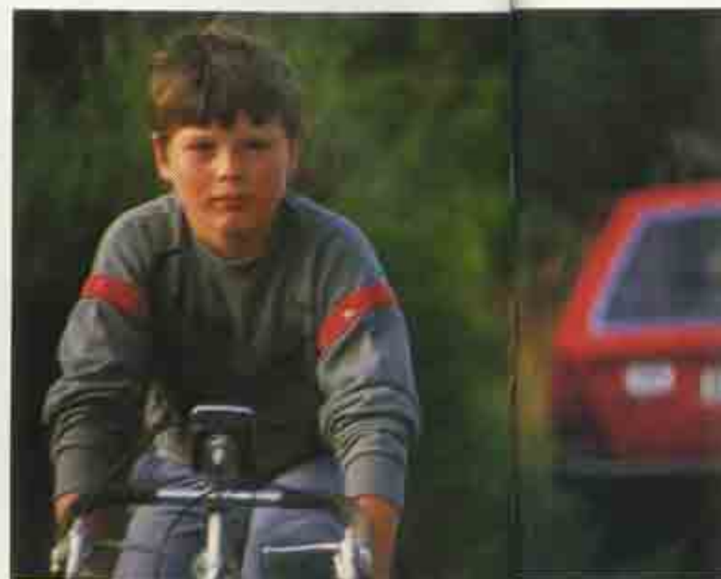
Stadt ist unser Schulweg.

Weder die Geborgenheit noch die Bewegungsfreiheit kann man messen. Oberflächliche Betrachtungsweise: Wenn viel Verkehr auf der Straße ist, ist die Stadt lebendig. Bei vielen Fußgängern – ja. Bei vielen Autos auch?