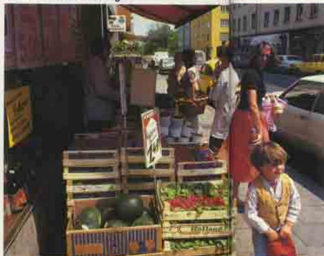
Stadt ist unser Gemüsehändler.