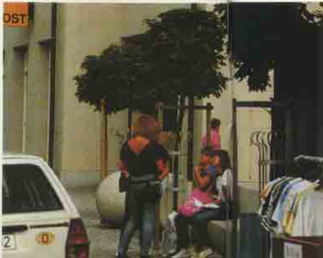
„Um vier Uhr in der Stadt.“