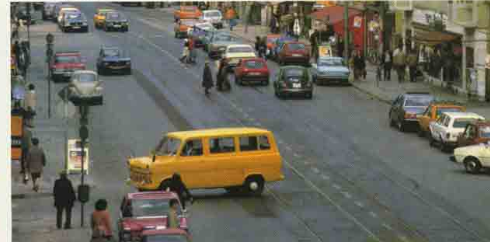
Stadt ist Verkehr auf unseren Straßen.